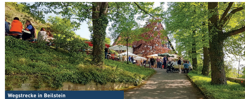
Wegstrecke in Beilstein