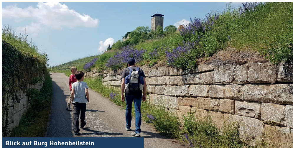
Blick auf Burg Hohenbeilstein

Hier geht's zur Tour in outdooractive mit Wegführung und Landkarte